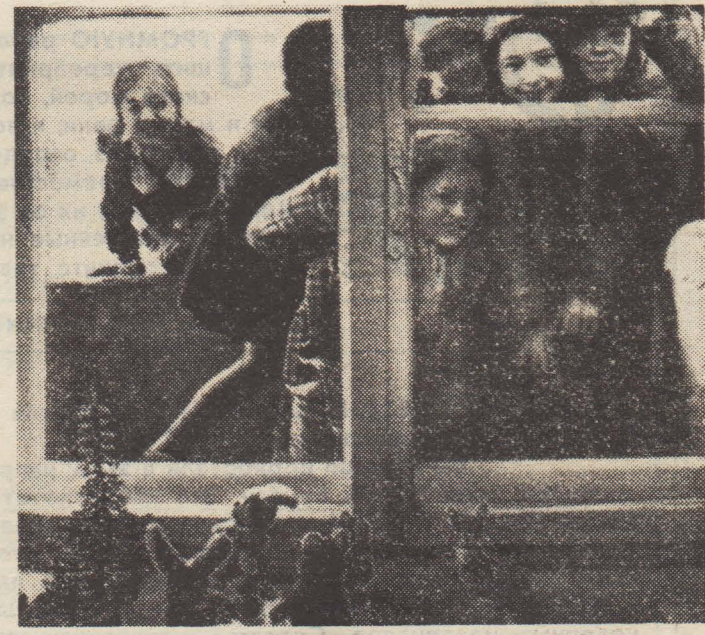
«ОСТАНОВИСЬ, МГНОВЕНЬЕ!» И в воскресенье в нашей школе царит оживление: остались минуты до открытия выставки, к которой готовились почти весь учебный год, — мастерили, клеили, красили, рисовали, лепили, шили и вязали. В светлом классе разместили все наши творения. Зрители уже собрались, а самые нетерпеливые прильнули к окну. Любопытно!

Принялись юные композиторы за новый сюжет — тоже хорошо всем знакомый. И вот опера «Чиполлино» готова. г. Новосибирск.