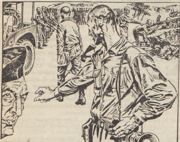
Рис. О. КОРНЕВА.