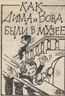
Рис. О. КОРНЕВА.

Дима и Вова гуляли по улицам и сильно замерзли.