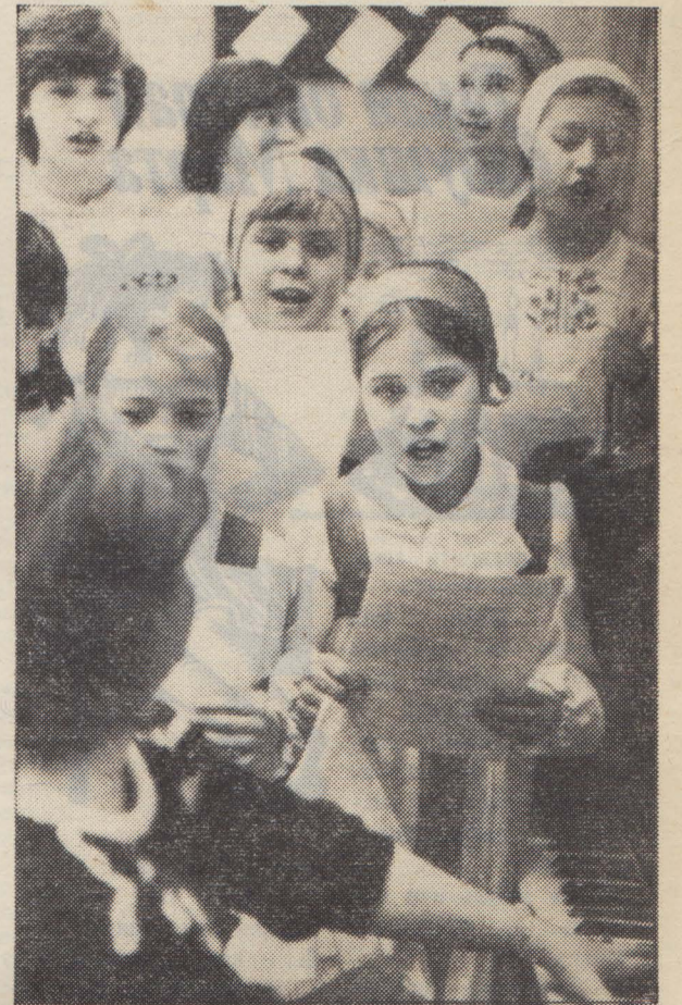
Москва, средняя школа № 214.

Пионерский ансамбль — дипломант городского фестиваля детского художественного творчества. Сейчас «Вёснущка» участвует во II Всесоюзном фестивале народного творчества.