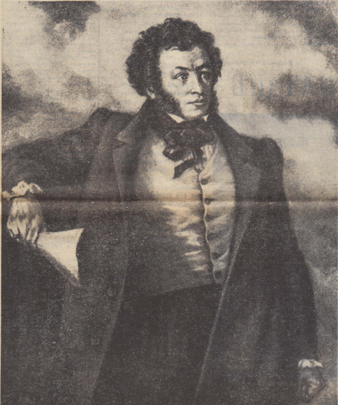
А. С. Пушкин. Портрет работы художника Р. Рухьяна.

Сегодня — День памяти великого русского поэта АЛЕКСАНДРА СЕРГЕЕВИЧА ПУШКИНА