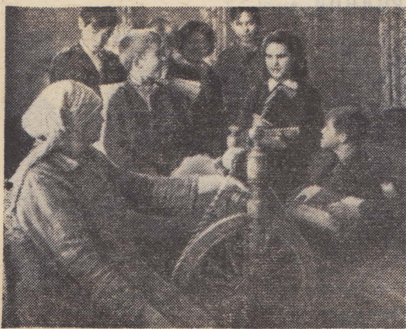
Рис. В. СТУПИНА.