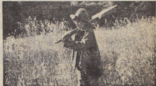
Кадр из фильма «Мальчик с пальчик».