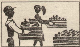
О-ряд. Слово и дело.

Идёт заседание совета дружины: предложения, сборы, идеи... Впереди — старт!