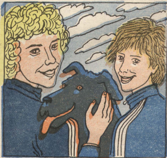
Рис. Н. КАРЕВОЙ

— Ребята, что мы натворили?! — спрашивал себя и друзей Электроник.