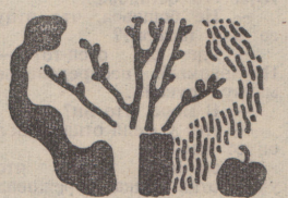
Рис. Н. САВЕЛЬЕВОЙ.