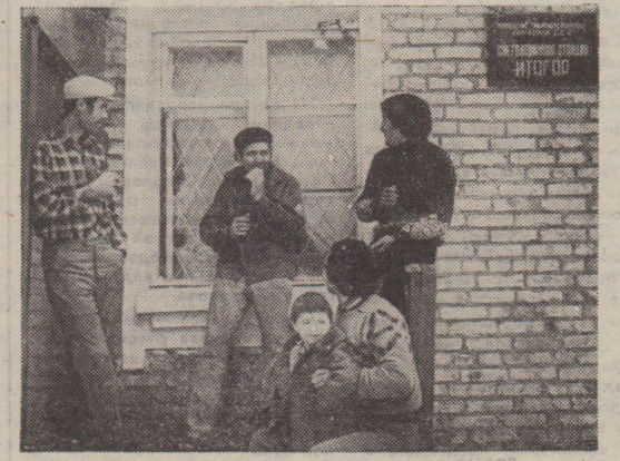
Киргизская ССР, Ошская область.

Вопросы задавал и читал документы П. НОВИКОВ, наш специальный корреспондент.