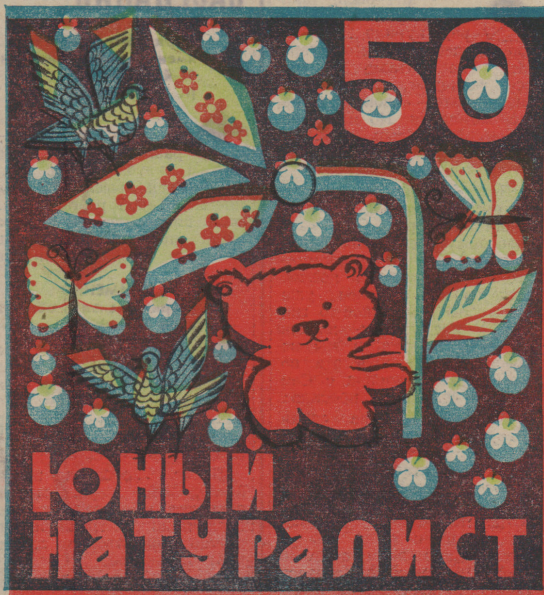
Рис. Н. КАРЕВОВ.

Вот это штука! Да тут их с десяток! И как это я их сразу не заметил! Но какие же это зубры? Мелкота какая-то, словно телёта. И все разные. Не выдерживаю и шёпотом обращаюсь к егерю. — Телёта и есть, — отвечает он. — Здесь детский сад. Один молодой.