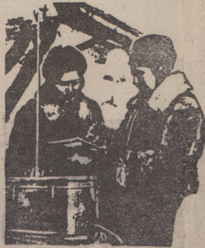
«ВОЛГА», «ВОЛГА»... Я — «НЕМАН»...

Орган ЦК и МК ВЛКСМ Суббота, 7 марта 1942 года. № 2. (9674)