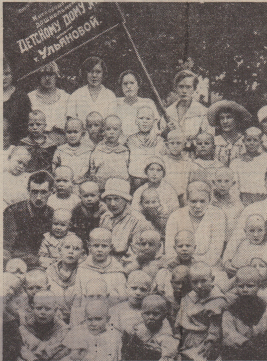
1924 год. Мария Ильинична Ульянова (справа) вместе с Надеждой Константиновной Крупской приехали в гости к ребятам исландского детского дома № 3 имени Ульяновой. Большинство этих детей лишились родителей в годы гражданской войны...

Мария Ильинична была партийным и государственным деятелем, она была достойной сестрой вождя революции! Советский народ любил, уважал её. На XVII съезде партии сестра Ленина призвала партийные организации укреплять связи с массами, чутко прислушиваться к их голосу, — быстро и правильно реагировать на жалобы трудящихся. И неудивительно, что съезд избрал Марию Ильиничну в Комиссию Советского контро-