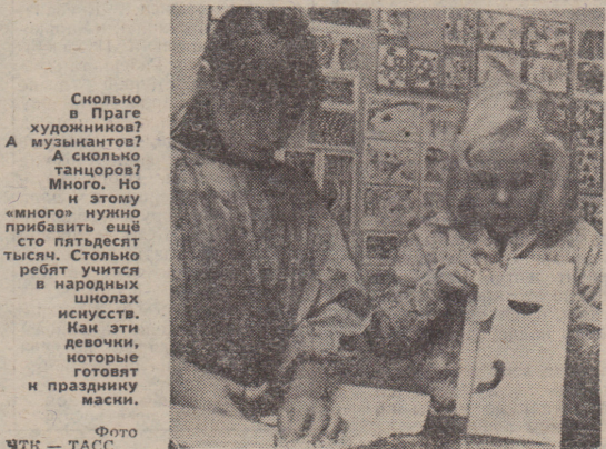
Сколько в Праге художников? А музыкантов? А танцоров? Много. Но и этому «много» нужно прибавить ещё сто пятьдесят тысяч. Столько ребят учится в народных школах искусств. Как эти девочки, которые готовят и празднику маски.

«Я ТВЕРДО убеждён: пока мир капитала не будет заменён справедливым обществом — социалистическим, наши дети окажутся в таком же незавидном положении безработных, как и мы теперь...»