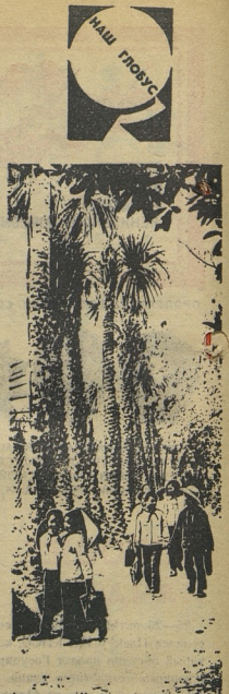
В школах Социалистического Вьетнама проведены первые в этом году уроки. Ваши вьетнамские сверстники сами за парту. Дети только что отгрызли язык шлоу. Социалистический Вьетнам заботится о ребятах, которым предстоит продолжить строительство нового Вьетнама.

Л. ПРУНЦОВА, (Наш специальный корреспондент). Костромская область, пос. Лопареве.