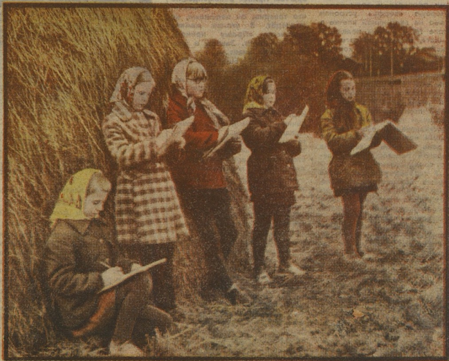
НА ОСЕННИХ ЭТЮДАХ. Волоколавская восьмилетняя школа Вологодской обл.