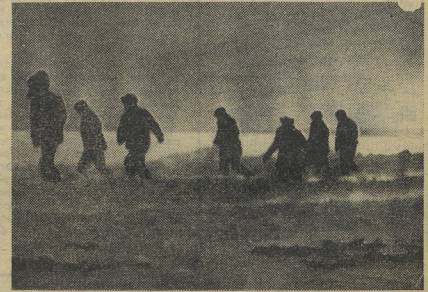
До буровой приходится добираться и в метель...