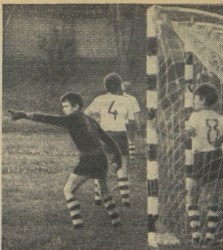
На снимках: сверху — играют команды Украины и Кировской области, атлетично и красиво; внизу — самые техничные игроки турнира готовятся к сдаче нормативов — футбольный слалом, жонглирование мячом и т. д.