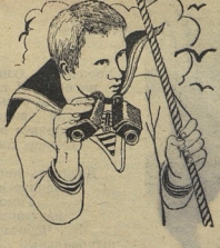
Рис. В. НИКИФОРОВА.

Ф. КАМАЛОВ, (Наш специальный корреспондент). г. Архангельск, яхт-клуб «Север».