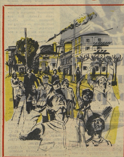
Иллюстрация к рассказу «Воробей».