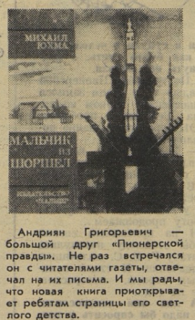
Андриян Григорьевич — большой друг «Пионерской правды». Не раз встречался он с читателями газеты, отвечал на их письма. И мы рады, что новая книга приоткрывает ребятам страницы его светлого детства.

стве дважды Героя Советского Союза, лётчика-космонавта Андрияна Николаева. Есть в книжке и забавные эпизоды — как Андрияна ходил глубокой ночью пологоним свистом, или как он сделал парашоуд и хотел прыгнуть с самого высокого дерева. Но есть эпизоды, которые говорят о том, что пионер Андрияна мог целый день наравне со взрослыми мать рожи. И как бы ни было трудно, он не оставил товарища в беде. И вроде бы ничего особенного. Но это обычное босоного детство рождало характер человека честного и скромного, смелого и любознательного, верного своей мечте и готового ради неё к самым нелёгким испытаниям.