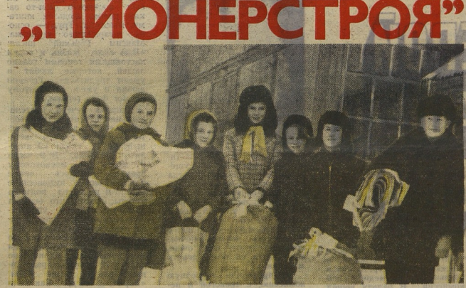
Соревнование «Миллион — Роднине» в пионерских отрядах Шумячской средней школы Смоленской области. Первенство в дружине держит 5-й класс «В». Отряд сдал более полутора тонн макулатуры.

17 АПРЕЛЯ — КОМУНИСТИЧЕСКИЙ СУБСОТНИК. В ЭТОТ ДЕНЬ ПИОНЕРСКОЕ ЗВЕНО, ОТРЯД, ДРУЖИНА — НА ТРУДОВОЙ ВАХТЕ. ДО ПРАЗДНИКА ТРУДА — ВОСЕМЬ ДНЕЙ!