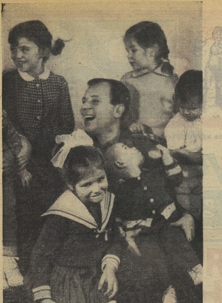
Генерал-майор авиации, лётчик-космонавт СССР А. А. ЛЕОНОВ, заместитель начальника Центра подготовки космонавтов имени Ю. Гагарина.

12 апреля — 15 лет со дня первого в мире полёта в космос Ю. ГАГАРИНА