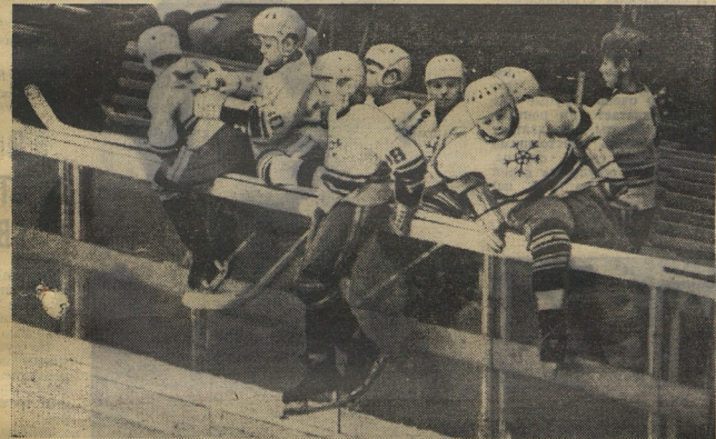
НА СНИМКЕ: команда «СНЕЖИНКА» из Подмоскovie.

[6024] Год издания 52-й. Пятница, 26 марта 1976 г. Цена 1 коп.