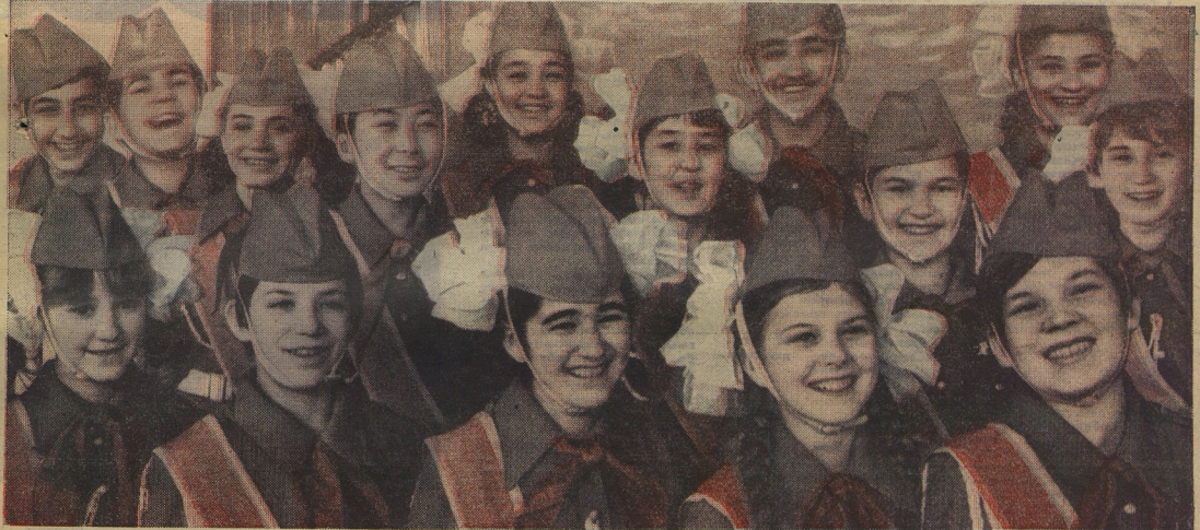
ОНИ, ПРЕДСТАВИТЕЛИ ВСЕХ СОЮЗНЫХ РЕСПУБЛИК, БУДУТ ПРИВЕТСТВОВАТЬ ДЕЛЕГАТОВ СЪЕЗДА.

Ленинская партия, написавшая на своих знамях планетный лозунг «Пролетарии всех стран, соединяйтесь!», борется не только ради блага советских людей, но и ради победы всех угнетённых народов. Минувшие пять лет войдут в историю как годы победы народа Вьетнама, признания миром немого государственного рабочего и крестьян — ГДР, краха португальских колониаторов, свержения фашистских диктатур в Лиссабоне и Афинах. Планета меняет своё лицо. Программа мира, которую предложила наша партия, стала началом взаимопонимания и сотрудничества народов Европы. Съезд призвал приветствовать коммунисты всех континентов нашей планеты. Мир с огромным вниманием будет следить за работой форума советских коммунистов.