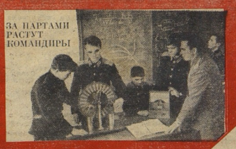
ЗА ПАРТИИ РАСТУТ КОМАНДИРЫ