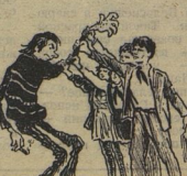
Рис. Л. СМЕХОВА.

С. ЧЫМАЛЕНКО, (Наш корреспондент), г. Свердловск.