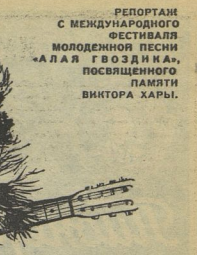
РЕПОРТАЖ С МЕЖДУНАРОДНОГО ФЕСТИВАЛЯ МОЛОДЕЖНЫХ ПЕСНИ «АЛАЯ ГВОЗДИКА», ПОСВЯЩЕННОГО ПАМЯТИ ВИКТОРА ХАРЫ.

И. Д. ЦВЕТАКОВА, (Имя специально не называется.)