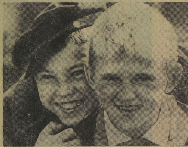
У тебя есть друг? Настоящий, верный? Если есть, ты поймешь этих мальчишек из Омской области. Им весело вместе.