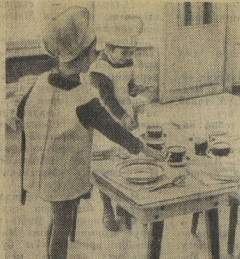
Скатерть-самобранка, конечно, хорошо, да только в жизни приходится и самому стол накрывать, друзей угощать.