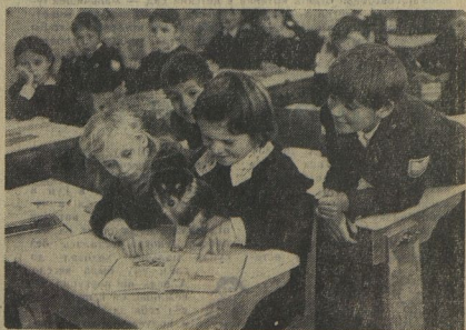
Скажите, пожалуйста, этот кулёк тоже пришёл учиться? Ростом с хариадом, но как классик! Вот он дисциплинированнейший, а уже больше шестнадцати лет, что ни говори — зверь. Нет, не на урок он приглашен, просто хозяйка его в провальной группе, а как мальчишу без хозяйки прожить целую день? Вот и попал он в двадцатку мовковскую школу Третьеклассники рабы товарищи, только спонуют хозяйке приучать собаку к самостоятельности.