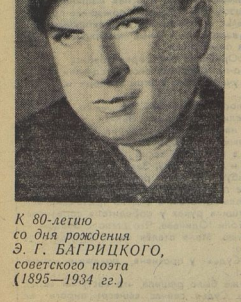
К 80-летию со дня рождения Э. Г. БАГРИЦКОГО, советского поэта (1895—1934 гг.)

Бунтуют фронты... Над землей снеговой Покой наступил суровый, Чтоб грянула громеца над сонной змеей... Владимир Ленина звал... Багрицкий написал блестящие произведения, украшающие наше искусство. Это прежде всего «Дети чистоты» — источник такой чистоты и прозрачности, что его можно поставить рядом с меланхолическими поэзиями. Его строки звучат свежо и сильно и сегодня. Так же как и «Дума про Олеса», оставшаяся жеманой и драгоценным восточеством Багрицкого: его разговор с Дзержинским, «вдохновенная поэма об инфантильном индустриальном поэте», о поэзии, об июльских звездах и соловьях, о родном море, о Чёрном море. Поэзия Багрицкого выдержала испытание временем. Он стал одним из любимых поэтов советской молодёжи. Я прохочу по бузыбарам. Свист лёгких деревьев. Гудят колоды. Орденю oneself являю лист. Силою ветра к груди приленю. Сын мой! Четырнадцать лет прошло. Ты пионер и осенний воздух. Дарюк глоташа. На смуглых лоб Падают листья, цветы и звезды. Этот отбавренный праздничный день Палом отесской грозной каски. Это тебе — этих флагов тень. Красношерстяные лютые каски. Мир в этих топках — он нам навеки... Тылоу шагов и оркестровых томков. Грохот затухающих камней рек. Вой проводов — это он. Кругом он... «Сын мой, сосед мой, товарищ мой, Моему руку своего полжиз на плечо мой. Мы вместе шагаем в холод и зной... И ветер свежий, и счастье огромней. Каждый из нас, забьом к себе, Губы сухие, хрипя в борьбе. Делает лучше в мире дело.