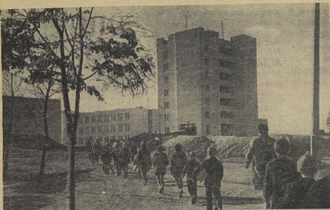
Село Верхняя Троица Калининской области. Со всех концов страны едут люди к дому, в котором родился Михаил Иванович Калинин. Рядом с этим старым домом выстроены современные здания. В одном из них недавно справлял новоселье средняя школа имени М. И. Калинина.

Сейчас пионеры этой школы готовятся отметить 100-летие со дня рождения своего славного земляка. Ребята встречаются с людьми, знавшими Михаила Ивановича, устраивают походы по калининским местам. 19 ноября пионеры вручат ветеранам партии памятные подарки и сувениры. Это знаменательное дело будут отмечать все советские люди.