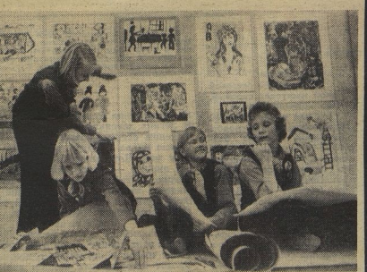
Звонок... Кончился последний урок. Но ребята не торопятся идти домой. У них серьёзные дела: школьный дубовый оркестр репетирует новую песню, клуб интернациональной дружбы печатит книгу песен и отвечает своим друзьям. А юные художники развешивают самые последние работы.

Пионерские символы воплощают в себе идею непрерывной связи трёх поколений. Отдавая салют пионерскому знамени, помни — тем самым ты говоришь: «И кланье, и пионерский крест, и парадное отдалан жисте героя, — делу революции, борьбе за прекрасное будущее!» Ты словно вновь провозносишь слова Торжественного обещания: «Всегда готов к борьбе за дело Коммунистической партии!»