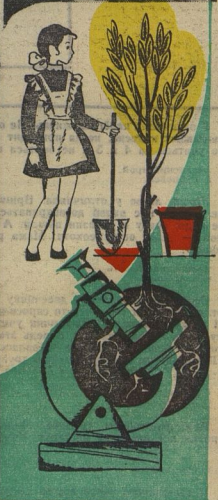
Рис. В. ВЛАДИЩЕНО.