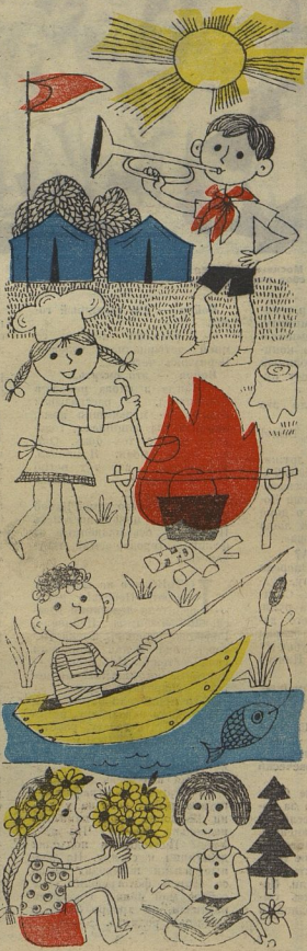
Художник Людмила Филиппова.

РАССКАЗ НАШИХ СПЕЦИАЛЬНЫХ КОРРЕСПОНДЕНТОВ ЧИТАЙТЕ НА 2-й СТРАНИЦЕ.