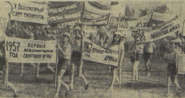
Разноцветные полтинки — страницы истории Артека.