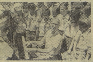
Дмитрий Борисович Кабалевский — большой друг артековцев.