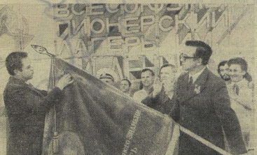
На знамени Артека — орден Дружбы народов.