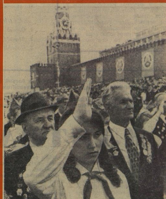
НА СНИМКАХ СВЕРХУ ВНИЗ: Москва, Кремльский Дворец съездов, 8 мая 1975 года. Торжественное собрание, посвящённое 30-летию Победы советского народа в Великой Отечественной войне. На торжественное собрание пришли пионеры и отряды. 9 мая. Торжественная манифестация на Красной площади.