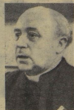
РАЙМОН Э. М. Э. ГОРР — каноник, общественный деятель Бельгии.