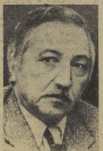
ЛУИС КОРВАЛАН — сенатор, Генеральный секретарь Коммунистической партии Чили;

Первого мая люди узнали имена ещё трёх новых лауреатов. Вот они, пламенные борцы за мир.