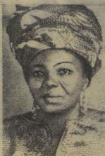
ЖАННА СИССЕ — общественная и политическая деятельница Гвинейской Республики;