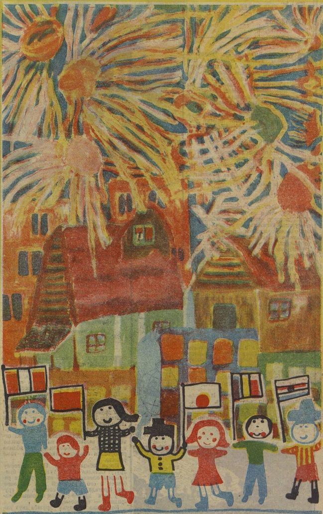
Этот планет сделан из двух рисунков. Авторы: Томислав СТАНКОВИЧ (Югославия) и Мария дель ПИЛАР НОРДОВА (Перу).

Раскрой газету, читатель. Рассмотрю внимательно рисунки, прочти, о чём думают, мечтают, каким видят мир твои сверстники.