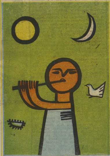
«ВЕСЕННЯЯ ПЕСНЯ», Явда Милетич (Югославия).