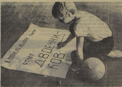
Фото в школьного, Москва, школа № 153.

Пусть-ка расскажет папы и мамы, как лежал учебник на скамейке и листал его апрельский ветер. Но заниматься надо! И есть блестящая возможность проверить свою силу воли. «Ты сколько прочитала? Вот это да! А я ещё только три странички...» Интересно, кому пришла идея отчёта двоечников? Может, это будет сатирическая стенгазета или диалог Пифа и Пафа в театре миниатюр? Может быть... Послушай, весна, не мешай, пожалуйста! Надо же, наконец, заниматься!