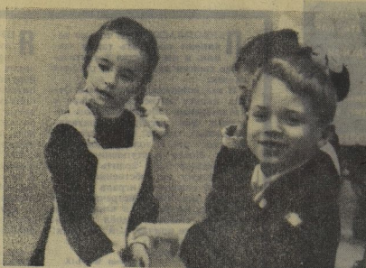
Олимпиада 1-го «Б» на перемене. Школа № 1 города Ульяновска.