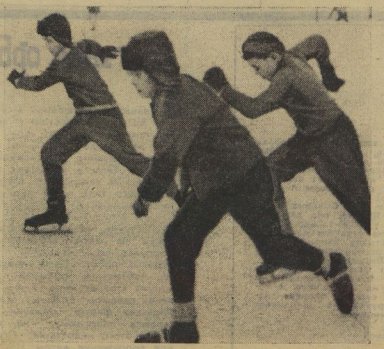
НА СНИМКЕ: один из забегов на московском стадионе «Лодиночка».

«...Мы хотим, чтобы снова затрепала слава советских конькобежцев. Мы выходим на лёд. Мы выходим на лёд, чтобы начать сражения за рекорды. От коротких дистанций мы пойдём на длинные дистанции олимпийских. Мы станем конькобежцами!» Так в воскресенье 26 января говорили участники массовых конькобежных состязаний, которые проводились под девизом «Лёд надежды нашей». Тысячи ребят выходили на ледяные дорожки Москвы, Горького, Свердловска, Алма-Аты, Ленинграда, Минска и Риги. И лучшие из них получили приглашения заниматься в спортивных школах.