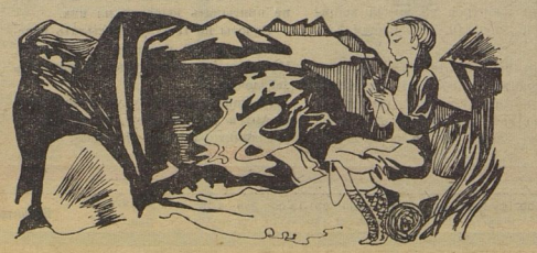
Рис. С. АНТОНОВА.