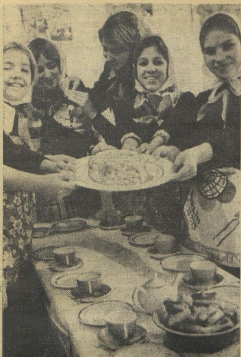
Всему ты научишь, школа: и решать задачи, и разбирать в самых сложных законах физики и химии, и даже печь вкусные торты и пироги. Но промах олимпиады сделала девочка всё запомнила в тетрадь, спрашивала учителя. Но вот первое практическое занятие, и посмотрите — какими вышел твой Ещё бы не радоваться восьмиклассницам! Спасибо, школа!, Меморская область, г. Новонунецки, школа № 41.