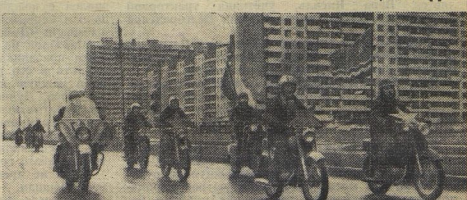
От метро «Юго-Западная» мотоциклисты 41-й московской школы взяли курс на подмосковный город Балашуху. Там состоялся торжественный съезд участников звадного автомототребга — советских и чехословацких школьников, посвящённый началу массовых советско-чехословацкой дружбы, 30-летию освобождения Чехословакии от фашистов и 30-летию Победы советского народа в Великой Отечественной войне.