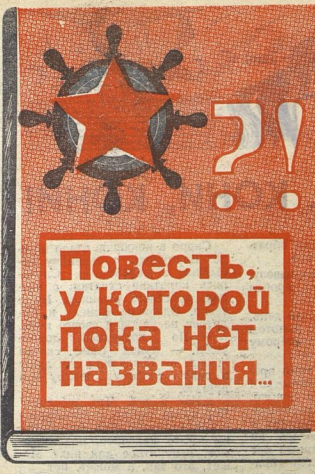
Рис. С. АНТОНОВА.

ПРИМЕЧАНИЕ ВТОРОЕ. Всем, кто ещё не успел включиться, но хочет вместе с другим писать повесть, не поздно это сделать и теперь.