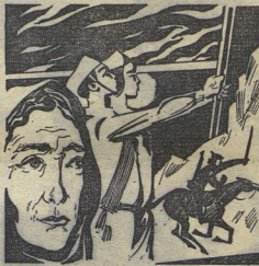
Рис. Б. ГЕФТЕРА

Таджикистан ССР, г. Байрақов, средняя школа № 1 имени В. И. Ленина.