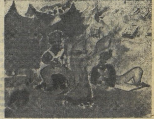
«БОРОДИНО». Акварель Оли ЩЕГЛОВОЙ.