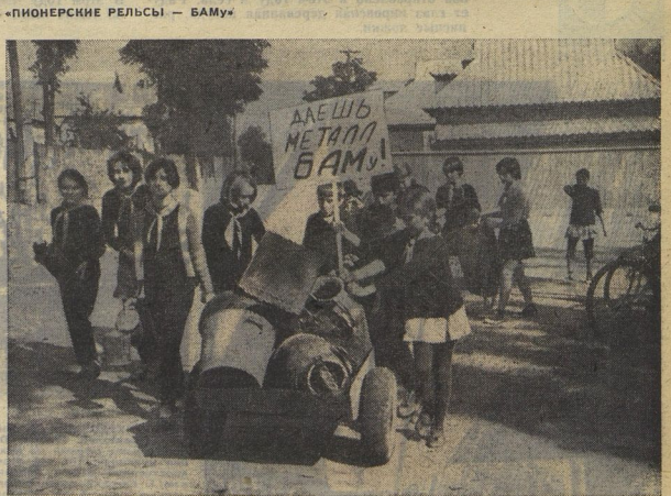
«ПИОНЕРСКИЕ РЕЛЬСЫ — БАМУ». Вот так в Симферополе собирают металлолом. Сделают из него рельсы. Пионеры! Вот почему в день проведения трудового десанта почти в каждом дворе лежат лежущие старые кастрюли, ведра, бидоны, банки. Грузи на тележки — и вези! На СИМФЕ собирают металлолом пионеры дружина имени В. Николаевича Герасимовича средней школы № 1.

Даже в напёрстке останется место, если в нём поместить две 27 экспонатов необычной выставки, открытой несколько дней назад в Государственном музее этнографии народов СССР. На выставке представлены работы одна уникальные другой, здесь и микроскопическая фотография Давиду Сулисскому, который установлен в столице Армении, и модель сиринки Страдивари размером в полмиллиметра, и игльное Ушко, в котором уместилась статуэтка Никколо Латини. А рядом — под стеклом сидит — восемь золотых фигурок девушек, танцующих на кусочке эфиринка ширинка. Все эти уникальные вещи остаются неизменяемыми, пока зритель не поведёт окуляр многогранного увеличения. Такой же сильной оптикой пользуются и их автор — конструктор Армянской филармонии Эдуард Казаарян, создавая свои композиции в часы досуга.