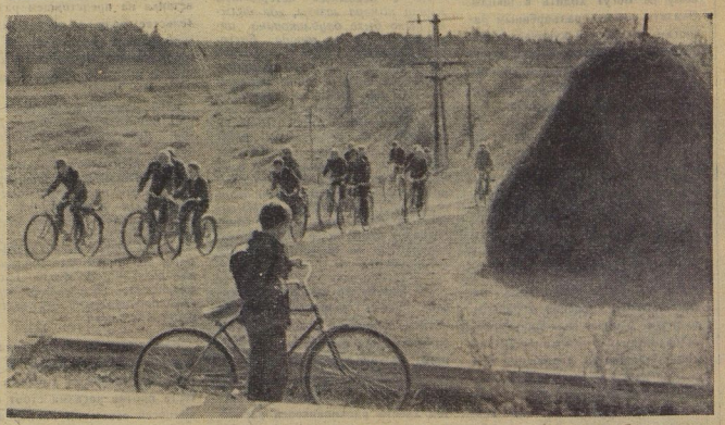
С холма на холм угоняет ветер вьюгу. Жмут на педали ноги. Тонко солнце играет в спицах, да ветер в валах. В Некирчанской школе Удмуртской АССР учащиеся играют в разных деревнях. Утром садятся они на велосипеды. По пути в школу и устраиваются велосипедные кроссы.

10 сентября штаб «Светофоры» бросил клич: «ПРОВЕРЬТЕ СВОИ «СВЕТОФОРЫ»! Со страниц «Пионерской правды» обратился к вам С. Н. Зайчиков, заместитель начальника управления ГАИ МВД СССР. Он дал вам три задания. КАК ВЫПОЛНЯЕТЕ ЗАДАНИЯ, ТОВАРИЩИ «СВЕТОФОРЫ»? ЖДУ ВАШИХ ДОНЕСЕНИЙ ДО 1 НОЯБРЯ А 10 НОЯБРЯ, В ДЕНЬ СОВЕТСКОЙ МИЛИЦИИ, БУДЕТ ДАН СТАРТ НОВОМУ ТУРУ ВСЕСОЮЗНОЙ ИГРЫ «СВЕТОФОР». ПАМЯТНОЕ ЗАДАНИЕ. ПЕРВОЕ: организовать во дворе дома, школы автопешеходку. ВТОРОЕ: устроить соревнования, конкурсы, игры. ТРЕТЬЕ: создать бригаду юных инспекторов движения. Я — «СИГНАЛ!» ПЕРЕХОЖУ НА ПРИЕМ!