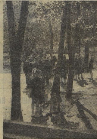
Последние погодине дни... Они много напоминают о недавнем лете. И в школьном дворе до начала уроков не смолкает разговоры, смех. Кто-то рассказывает смешной случай из лагерной жизни, кто-то вспоминал как с девятиклассными ребятами ездил в ночное... Но настоячий звон зовёт на уроки. Продолжается путешествие в страну Знаний... Москва, школа № 949, г. Долгопрудный школа № 9.