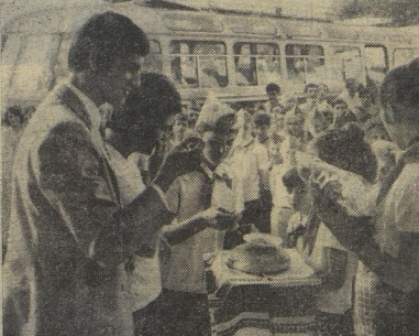
Хлебом и солёно встречали болгарские ребята пионерский поезд Дружбы из СССР.

Иван ИВАНОВ, (Агентство печати «София-пресс»).