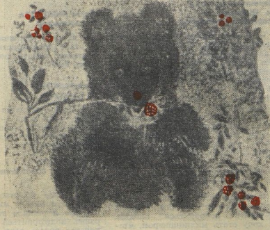
Весёлый мишка, которого нарисовал художник Е. Чарушин, стал эмблемой выставки.