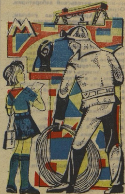
Рис. В. КОВЫНЕВА.