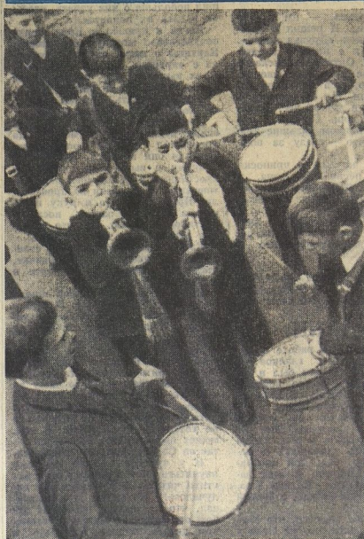
Школу горнистов и барабанщиков для октябрят открыли пионеры 24-й школы города Рыбинска.

НАШ АДРЕС: 101502, ГСП, Москва, К-30, Суховьянская, 21. Телефон: 251-15-00, доб. 2-38. Типография ордена Трудового Красного Знамени изд-ва ЦК ВЛКСМ «Молодая гвардия».