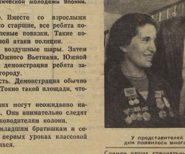
У представителей Союза молодых рабочих за освобождение (СМЯ) в эти дни появилось много новых друзей.