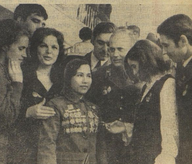
НГУЕН ТХИ Е — героиня Народно-вооружённых сил освобождения Южного Вьетнама.