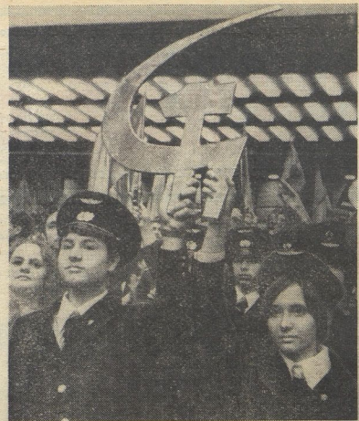
Делегатов съезда приветствует юная смена рабочего класса.