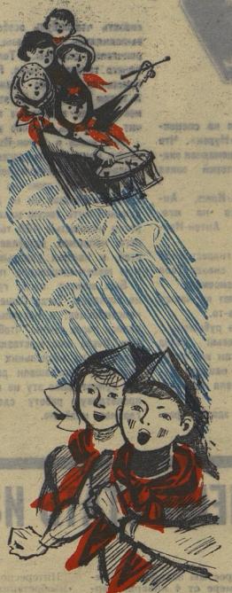
Рис. Бориса ГЕФЕРА

У каждого пионерского отряда есть имя. У каждого отряда должна быть песня.