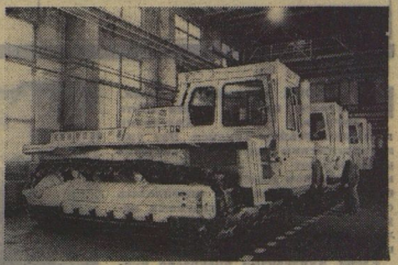
«Т-500» — сегодня самый мощный трактор.

С. МОРОДИН, г. Челябинск. (Наш специальный корреспондент).