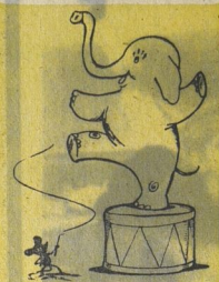
Рис. С. АНТОНОВА.