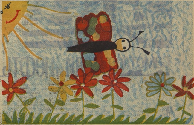
«ЦВЕТЫ И БАБОЧКА». Рисунок Гизелы Фернандес.

Визит Леонида Ильича Брежнева на Кубу будет способствовать тому, что ещё теснее станет дружба и сотрудничество между нашими народами.